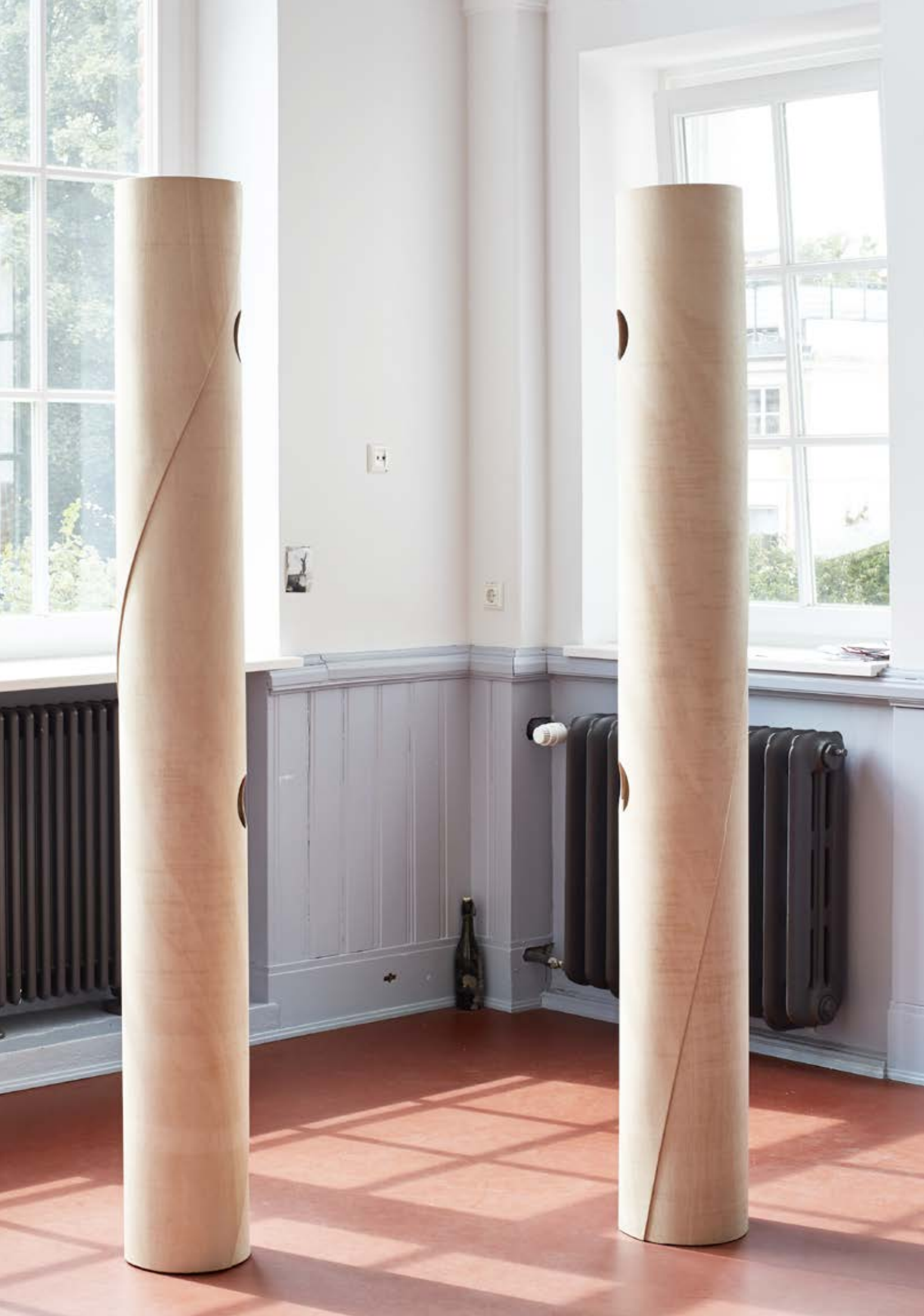
Trapez 1, 2014 Biegesperrholz Höhe: 197 , Durchmesser: 26 cm