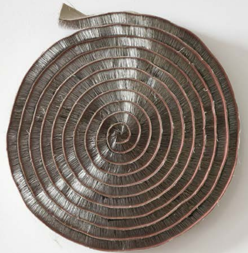
© T, 2014 Bürstenband Durchmesser: 48 cm