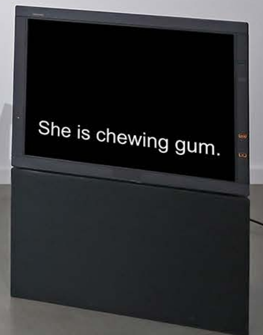
Chewing gum (TV Version), 2018 Video-Loop (3:49 min)