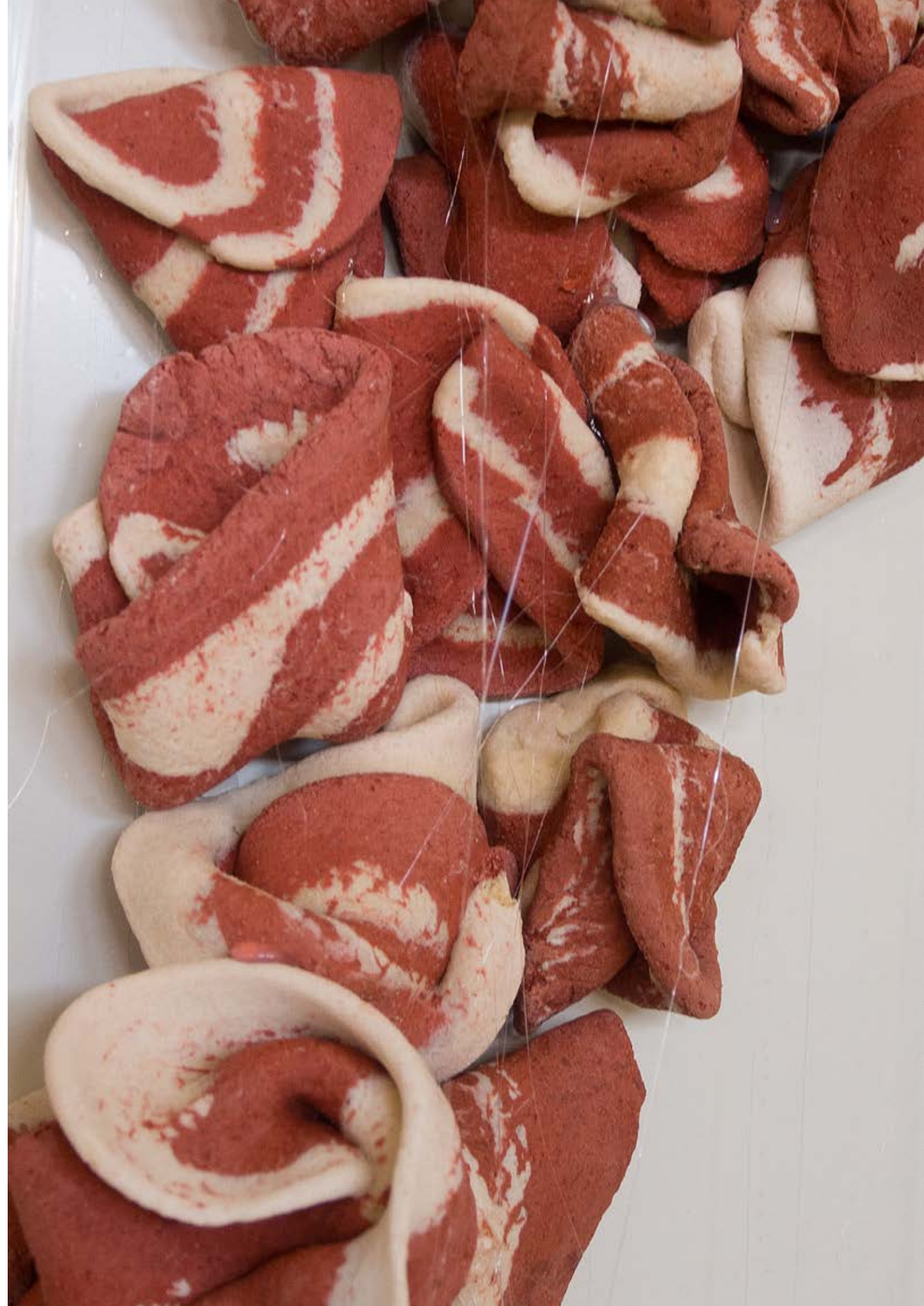
Cheese, 2018 Detailansicht, Salzteig, Heisskleber ca. 400 x 90 cm