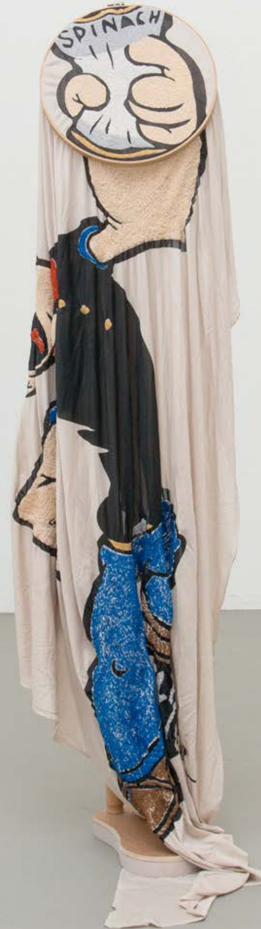
Engaged In Certain Types Of Abilities , 2015 Polyester, Polyamidfaden, Stickrahmen mit Gestell 140x30 cm