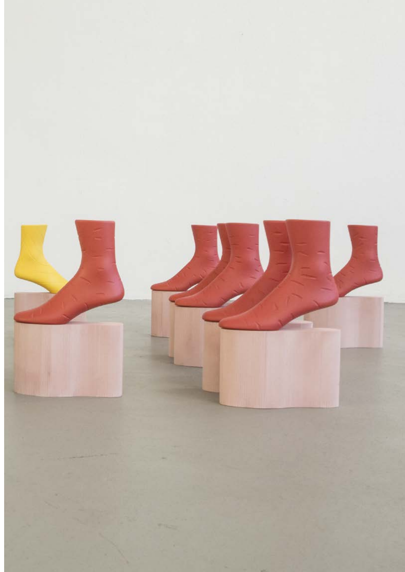
Looming Fruits: Cha Cha Cha, 2017 Porzellan, Lack, Formstoff 170x140 cm